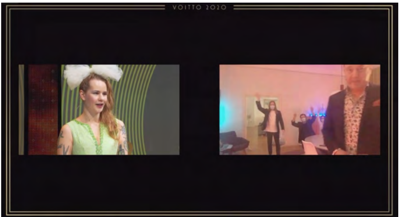
Online-tilaisuutena järjestetyssä Voitto-gaalassa Vuoden tuotantoyhtiönä palkittiin jälleen Otto Tuotanto.

Elokuulle kaavailtu Screen Helsinki –ammattilaistapahtuma av-alalle päätettiin siirtää jo toistamiseen koronapandemian vuoksi vuodelle eteenpäin.