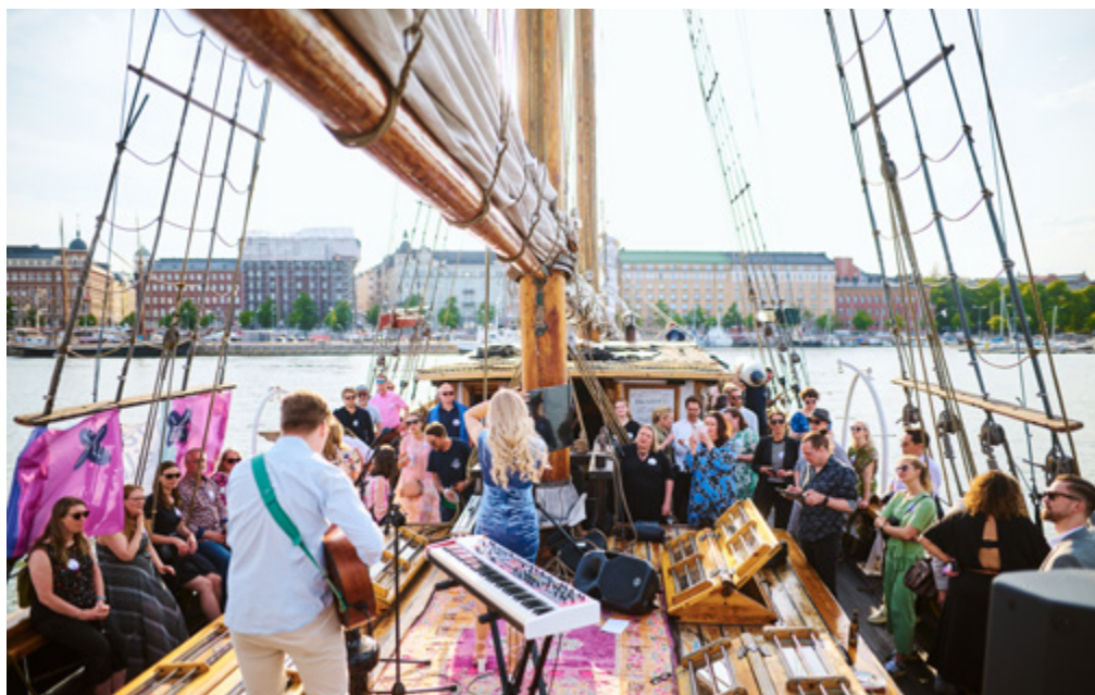
Luovat ry kokosi kesä- kuussa yhteen luovan alan ja päättäjät Luov- vat laineilla -risteilylle. Kuvassa tapahtumassa esiintynyt VIIVI.

APFI oli jäsenenä mm. Elinkei- noelämän keskusliitto EK ry:ssä, Helsingin seudun kauppakamaris- sa, Koulukino ry:ssä, Luovan työn tekijät ja yrittäjät – Luovat ry:ssä, Mediakasvatusseura ry:ssä, Palve- lualojen työnantajat PALTA ry:ssä, Suomen Yrittäjissä, Tekijänoikeuden tiedotus- ja valvontakeskus TTVK