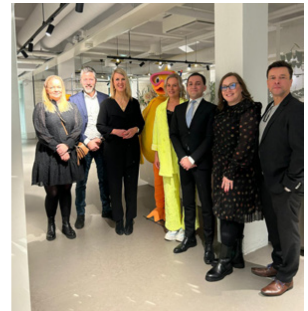
APFI ja MTV kutsuivat tiede- ja kulttuuriministeri Sari Multalan sekä elinkeinoministeri Wille Rydmanin Tanssii Tähtien Kanssa finaali-ilähtykseen tutustumaan suoran viihde- ohjelman kulisseihin ja kes- kustelemaan ajankohtaisista aiheista av-alalla.

APFI tarjosi jäsenyrityksilleen av- alan sopimukseen ja immateriaa- lioikeuksiin liittyvää oikeudellista asiantuntijapalvelua sekä työoi- keudellista neuvontaa. Sopimus- neuvonta toteutetaan ulkoisen kumppanin toimesta.