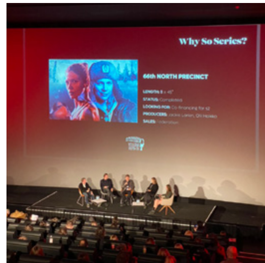
Berlinale Series Marketissa järjestetty Why So Series? -paneelikeskustelu esitteli täydelle yleisölle suomalaisia komediasarjoja.

Showcase-tapahtumiin ja paneelisiin valituille tuottajille järjestettiin esiintymis- ja pitchausvalmennusta. Lisäksi APFI järjesti konsepti- ja käsikirjoitusvalmennusta ja -kehit-