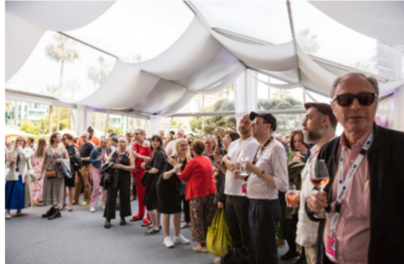
Cannesin elokuvajuhlien Series Mania Forumissa Suomi-tilaisuus. Series Mania Forumissa nähtiin jo perinteeksi muodostunut Coming Next from Finland -showcase